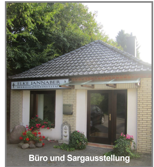
Büro und Sargausstellung

Tag und Nacht erreichbar Telefon: 05404/5127 oder 2237